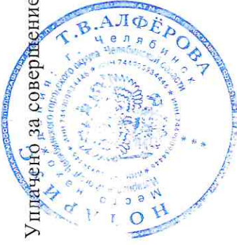
Т. В. Алфёрова

Уплачено за совершение нотариального действия: 120 руб. 00 коп.